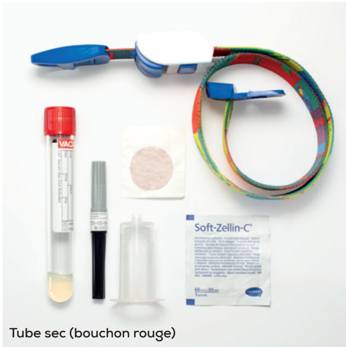
Tube sec (bouchon rouge)